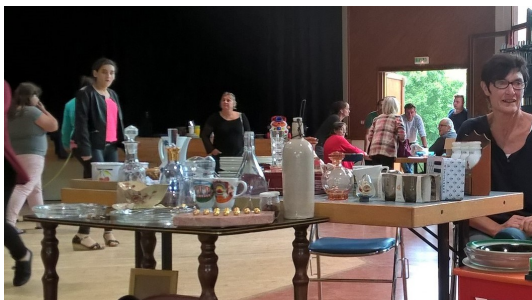
Bibelots en tous genres à dénicher au vide-grenier

Et à l'approche de Noël, rendez-vous est donné aux familles pour décorer le bourg le samedi 16 décembre dès 15h.